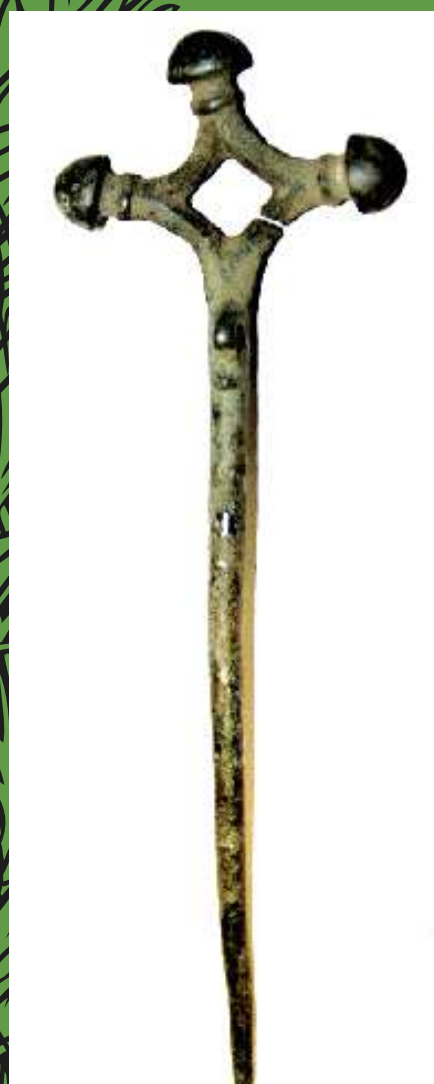
Krustadata 6.-7.gs. Vilces Dambīšu senkapi

Zemgaļu tērpa jautājums ir maz pētīts, bet ir viena lieta, par ko pētnieki ir vienojušies - sievietes tērpa dekorēšanai izmantojušas rotadatas ar krustveida galvu, un vīrieši izmantojuši bronzas stopsaktu.