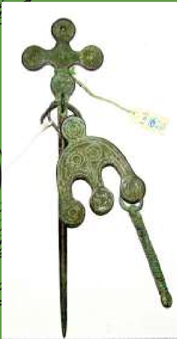
Krustadata ar važturi Ap 11.gs. Tupiņu aiza, Bauskas apkārtnē

Zemgaļiem bijuši cieši kontakti ar kaimiņu tautām un ciltīm, kā rezultātā kādas senlietas īpašnieks varēja būt zemgālis, sēlis vai kāds cits.