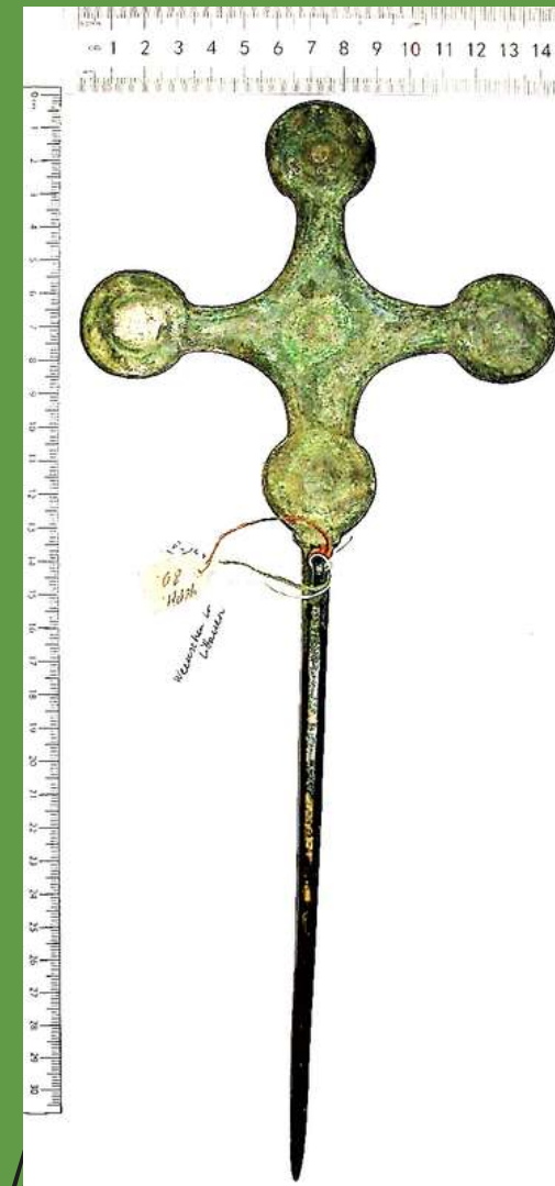
Krustadata 11.-12.gs. Viekšņi, Lietuva