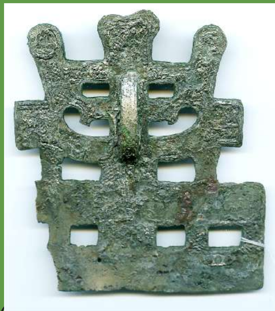
Bronzas stopsakta ar šķēršiem ar sudraba platējumu. 11.-12.gs. Vircava